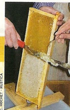
C. HOCHET - RUSTICA

Par temps chaud, le risque d'essaimage est multiplié. Cela peut réduire considérablement vos récoltes. Renouvelez les reines. Déclinantes, elles sont plus essaimeuses. Récupérez une grappe d'abeilles quittant la ruche, placez des hausses ou une ruchette à proximité, ou installez un piège.